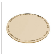
8433962 Lebensmittelfilter für Backwaren