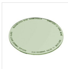
8433964 Lebensmittelfilter für Gemüsewaren