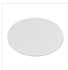
8414900 Schutzscheibe, mattiert