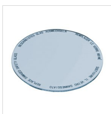
8433965 Lebensmittelfilter für Fischwaren