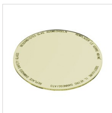
8433963 Lebensmittelfilter für Obst- und Käsewaren