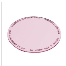
8433961 Lebensmittelfilter für Fleisch- und Wurstwaren