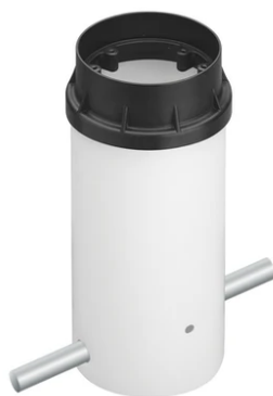
Box for ground installation F001Z020000