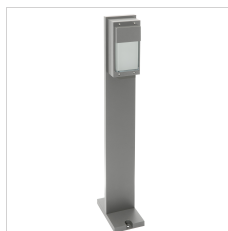
315025 Mast Bliz H.1000 Grau metallic