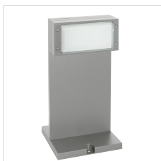
315027 Mast Bliz H.500 Grau metallic