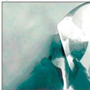
1 Led COB 10W max 250mA - 1100 Lm emessi - 3000°K - CRI 85 CE Classe I - IP 20 - Made in Italy