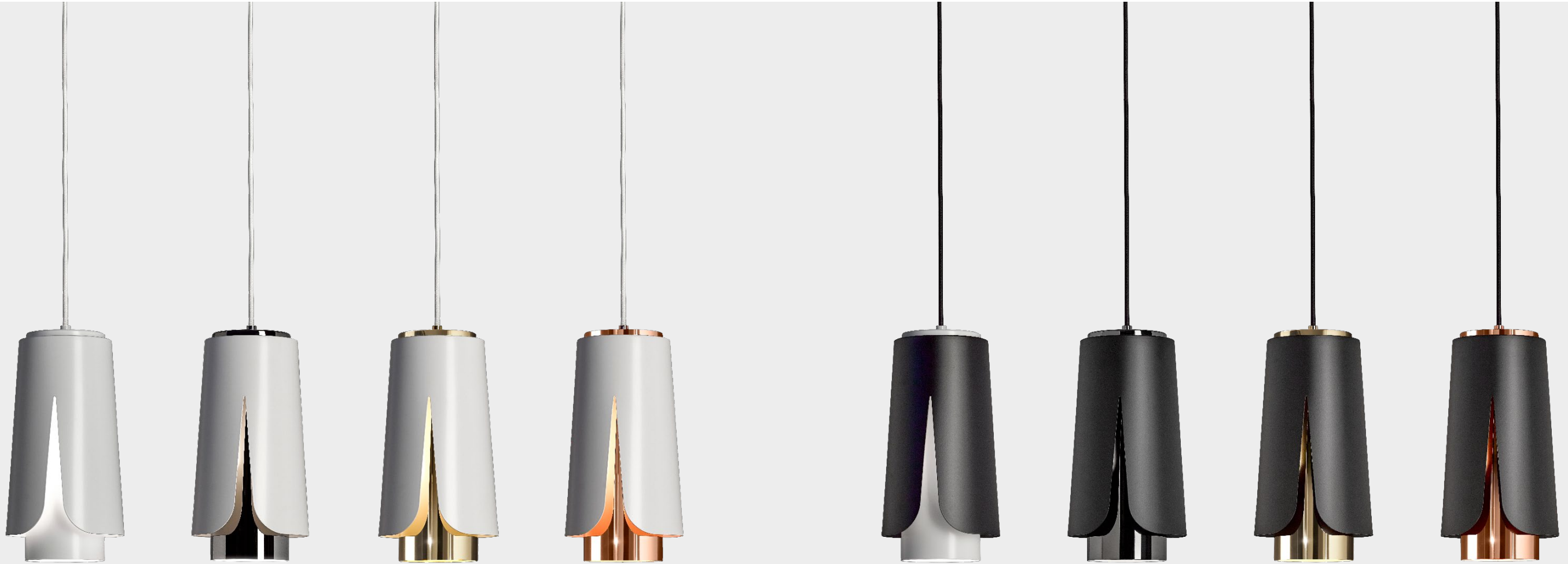
Tulipa Matt white Matt white

The eight colour combinations have been designed to offer interesting unions and contrasts between opaque and glossy finishes, but the materials allow you to write numerous other unpublished chapters as well with custom colors on request.