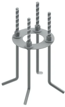
Base plate with bolt F023Z060000