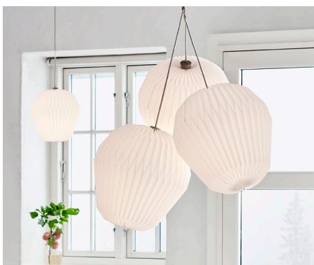
THE BOUQUET Chandelier · Model 130XL3