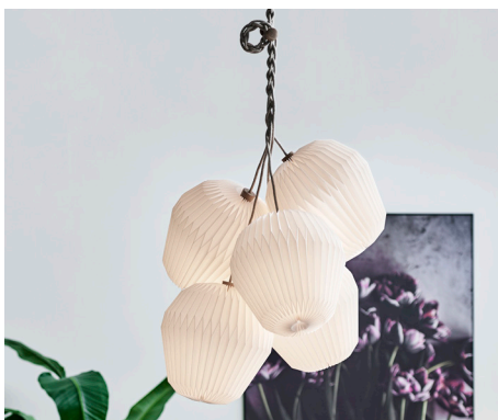
THE BOUQUET Chandelier · Model 130L5