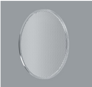
73997.000 Spherolitlinse extra wide flood aus optischem Polymer. Werkzeuglos wechselbar.