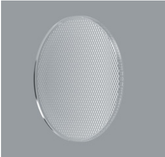
70858.000 Spherolitlinse flood aus optischem Polymer. Werkzeuglos wechselbar.