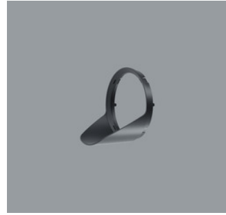
70634.000 Snoot Kunststoff. Schwarz