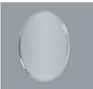
70861.000 Spherolitlinse wallwash aus optischem Polymer. Werkzeuglos wechselbar.