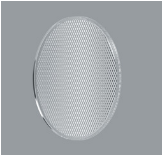
70859.000 Spherolitlinse wide flood aus optischem Polymer. Werkzeuglos wechselbar.