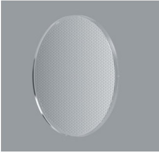
70857.000 Spherolitlinse spot aus optischem Polymer. Werkzeuglos wechselbar.