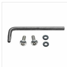
310177 Zerstörungssicheres Set, brüniert