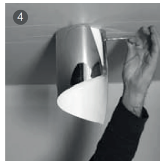
GU10 LED 8W - 230V - 650Lm emessi = 75W I Classe IP 20 - Fatto in Italia