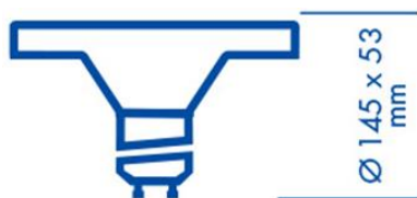
Abmessungsskizze LED LM85495

Die Lichtfarbe warmweiß oder neutralweiß sind mit jedem Lichtschalter durch Ein/Aus-schalten einstellbar.