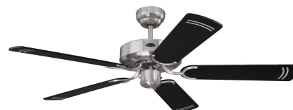
Schwarz mit Silberstreifen